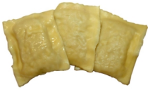
3 Maultaschen gefüllt mit unserem Saumagen.